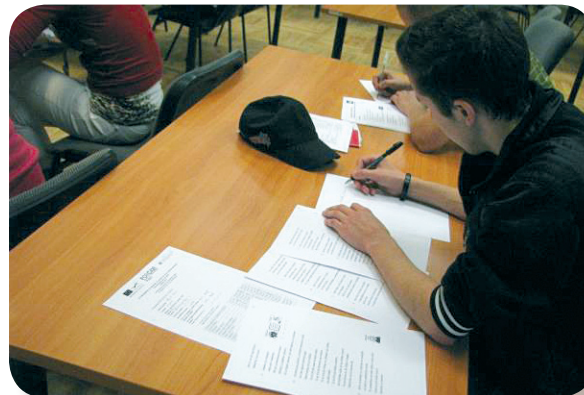
Foto no Sociālās atstumtības riskam pakļauto personu apmācības procesa