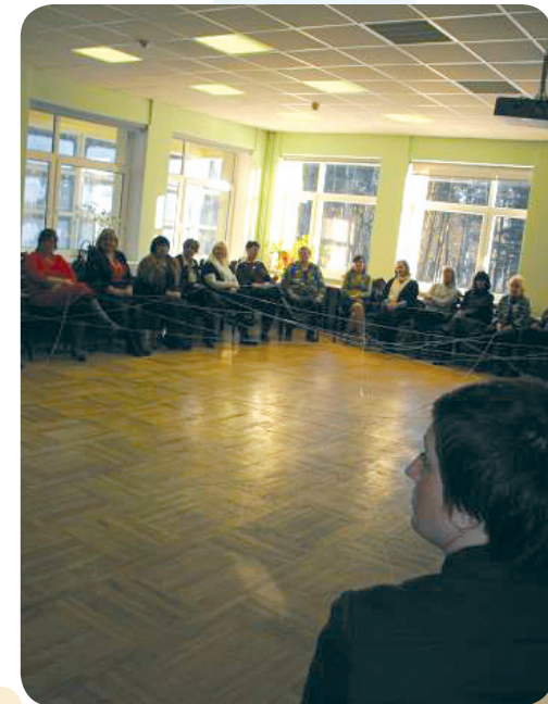
Foto no semināra „Dzīves kvalitāte”